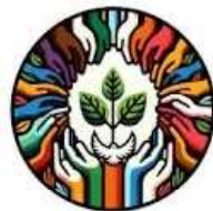
As primícias da esperança (Rm 8:19-25)