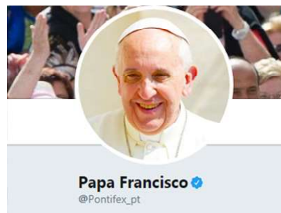
Twitter Papa Francisco - 25 de junho

"Comecemos pelos inúmeros testemunhos de amor generoso e livre que nestes meses nos ensinaram o quanto existe a necessidade de proximidade, de cuidado, de sacrifício para alimentar a fraternidade e a convivência civil. Desse modo, sairemos mais fortes desta crise. "