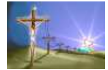
Julgamento de Jesus Execução de Jesus Sepultura de Jesus