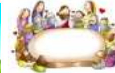
Última Ceia de Jesus Jesus lava os pés aos discípulos Institui a Eucaristia