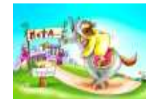
Entrada triunfal de Jesus em Jerusalém Projeta-se a sua morte

Senhor, Contigo eu posso levar a minha cruz. Ajuda-me a permanecer fiel e firme na profissão da minha fé, até ao fim.