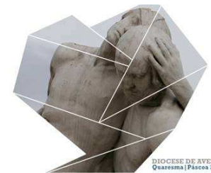
DIOCESE DE AVEIRO Quaresma | Páscoa 2016

Durante as semanas do Tempo Pascal somos todos desafiados a pôr em prática as obras de misericórdia, uma corporal e uma espiritual em cada semana.