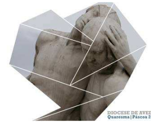
DIOCESE DE AVEIRO Quaresma | Páscoa 2016

Durante as semanas do Tempo Pascal somos todos desafiados a pôr em prática as obras de misericórdia, uma corporal e uma espiritual em cada semana.