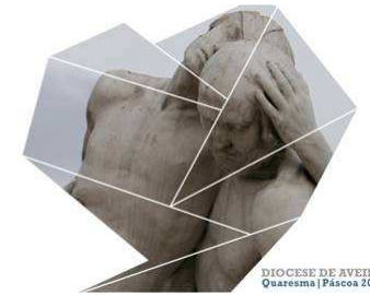
DIOCESE DE AVEIRO Quaresma | Páscoa 2016

Para ajudar a este caminho pascal, na catequese, as crianças do 1.º ao 4.º ano receberão um folha e depois, semana a semana, um autocolante com cada obra de misericórdia. Os adolescentes e o jovens, na catequese, tal como a restante comunidade, no final das missas, receberão um cartão com as 14 obras de misericórdia.