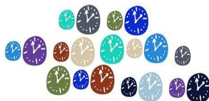
Assembleia de Animadores de Aveiro

O Departamento da Pastoral Juvenil promove no próximo sábado, dia 21 , a A3 - Assembleia de Animadores de Aveiro, das 9h às 13h, no Seminário Diocesano. Destina-se a TODOS aqueles que trabalham com grupos em idade juvenil (catequistas, animadores, responsáveis de movimentos juvenis) e inclui ainda um encontro diocesano para catequistas/animadores de grupos de preparação para o Sacramento do Crisma. O desafio lançado é " O tempo perguntou ao tempo ".