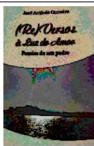
Livro à venda no Cartório. Custa 7,50 euros.