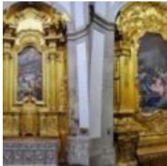
Homilia do bispo de Lamego na Solenidade de Santa Maria, Mãe de Deus