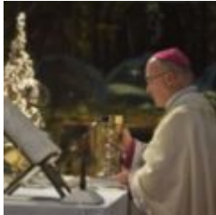
Homilia do bispo do Funchal na solenidade de Santa Maria, Mãe de Deus